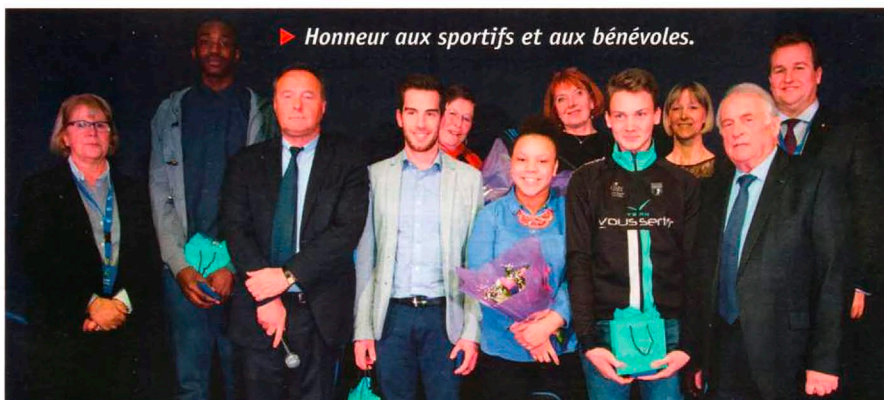
► Honneur aux sportifs et aux bénévoles.